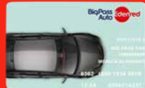
BigPass Auto Edenred