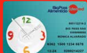
BigPass Alimenticio Edenred