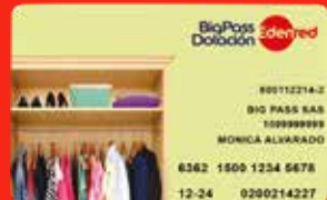
BigPass Dotación Edenred