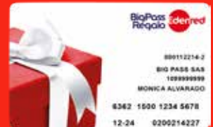
BigPass Regalo Edenred